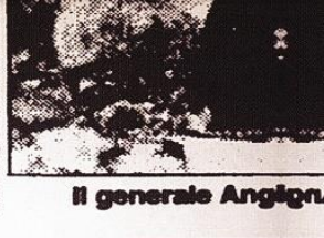
Il generale Angignone

...anni erano presso il contingen- ...te delle Nazioni Unite nel sud ...Libano. Abbiamo realizzato ...una vera operazione di 'peace- ...keeping', rimanendo al di so- ...pra delle parti, senza schierar- ...ci. Credo ci sia di che essere ...soddisfatti».