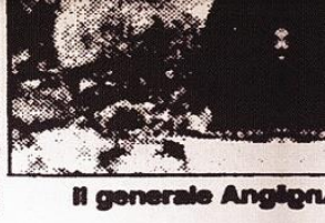
Il generale Angino

anni erano presso il contingen- te delle Nazioni Unite nel sud Libano. Abbiamo realizzato una vera operazione di 'peace- keeping', rimanendo al di so- pra delle parti, senza schierar- ci. Credo ci sia di che essere soddisfatti».