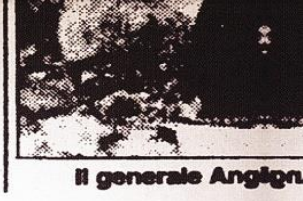
Il generale Angiolo Del Boca

...anni erano presso il contingente ...delle Nazioni Unite nel sud ...Libano. Abbiamo realizzato ...una vera operazione di 'peace- ...keeping', rimanendo al di so- ...pra delle parti, senza schierar- ...ci. Credo ci sia di che essere ...soddisfatti».