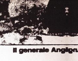
Il generale Angino

anni erano presso il contingente delle Nazioni Unite nel sud Libano. Abbiamo realizzato una vera operazione di 'peace- keeping', rimanendo al di sopra delle parti, senza schierarci. Credo ci sia di che essere soddisfatti».